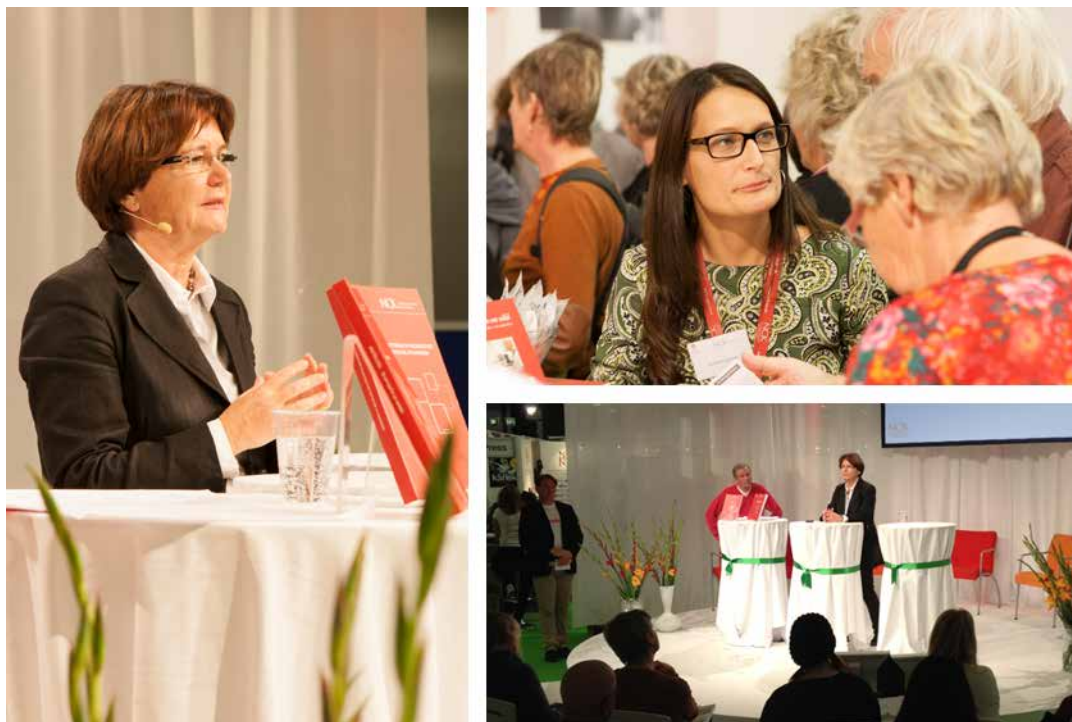
NCK medverade på forskartorget, Bok & biblioteksmässan, Göteborg.

kaféet, med Sveriges kommuner och landsting, SKL, som huvudarrangör.