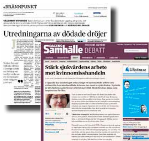
Debattartiklarna i Svenska Dagbladet och Dagens Samhälle fick ett stort genomslag.

Kvinnofridslinjen har publicerats i samband med rapportering om våld eller övergrepp mot kvinnor, i såväl tryckta medier som på webben och i tv.