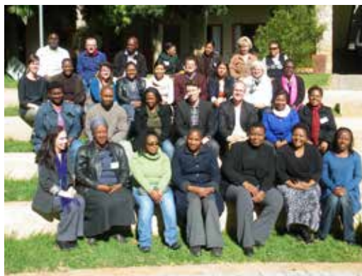
En av grupperna som NCK utbildade i Syd Afrika

Under 2012 har NCK utvecklat kursplaner, scheman och utbildningsmaterial för två kurser som har skolpersonal i Sydafrika som målgrupp. NCK genomförde en utbildning för utbildare i Pretoria: Training of Trainers for Educators .