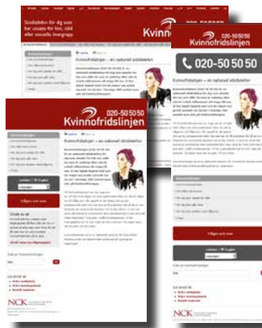
Kvinnofridslinjen.se har nu en följsam webbdesign, som anpassas efter skärmens storlek.

Informationen till hälso- och sjukvårdspersonal har utökats med mer information och material att ladda ner. Även sidor med information om våld på lättläst svenska har tagits fram.